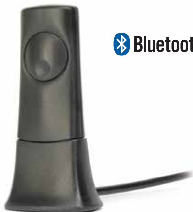
Model: BT100 (JAN:4571408311242) 価格: オープンプライス