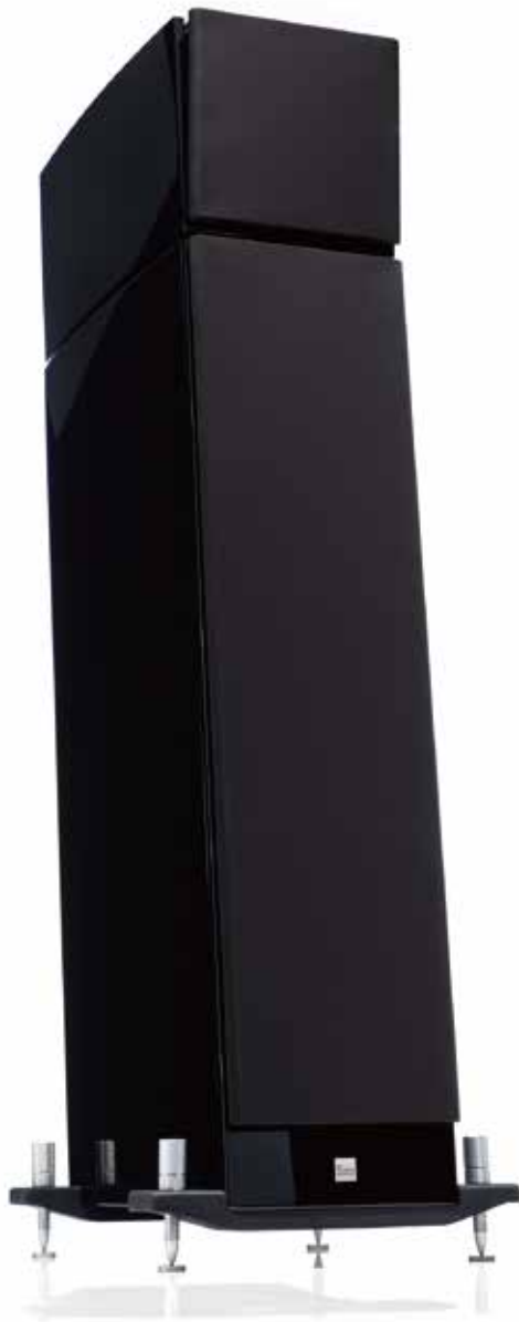
Model : THE MUSIC BLACK (カラー : PianoBlack) JAN : 4571408310276