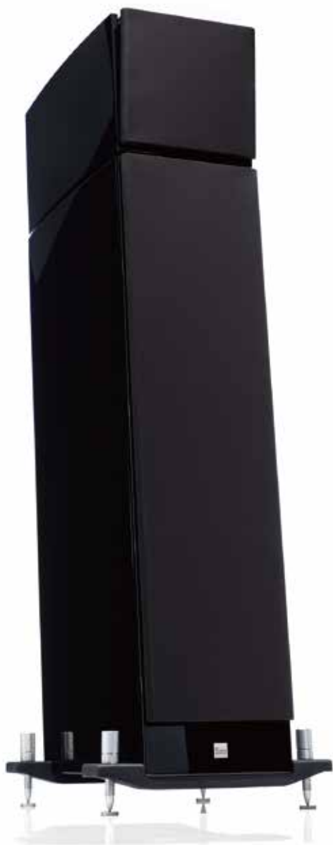
Model : THE MUSIC BLACK (カラー : PianoBlack) JAN : 4571408310276