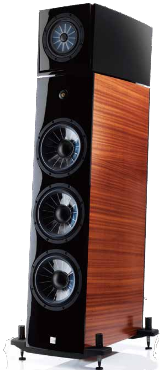
Model : THE MUSIC SAPELE (カラー : Sapele) JAN : 4571408310269