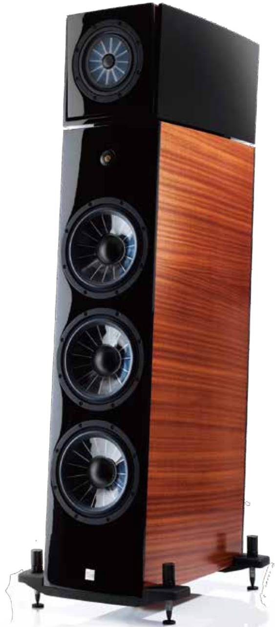
Model : THE MUSIC SAPELE (カラー : Sapele) JAN : 4571408310269