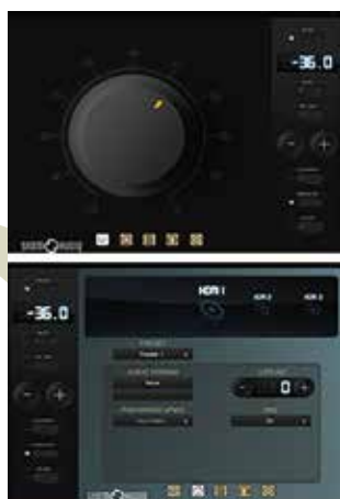
アプリで提供されるコントローラー

Storm AudioのAVプリプロセッサが世界中で注目を集めている理由は他にもあります。それが、SPHERE AUDIOモードです。これは標準的な高品質のステレオヘッドフォンを介して臨場感あふれるサウンド体験を実現するStorm Audio独自のバイノーラルヘッドフォン技術です。つまり、ステレオヘッドフォンとヘッドフォンアンプをISP 3D.16 ELITEに接続すれば、全ての音源がイマーシブ・サウンドに変換されます。大きな音が出せない夜中もこれからは気にする必要はありません。Storm Audioさえあれば、ヘッドフォンでも最高のイマーシブ・サウンドを得られるのですから。