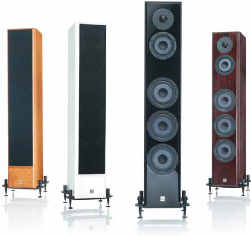
木目が美しいチェリー仕上げ(CRY)