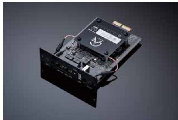
型番：SM35 / 価格：¥75,000 (税別)

SM35は、CD35およびDM35を搭載したI25やI35、PRE35にPRIMAREが誇るPRISMA機能を追加するためのオプション・モジュールです。DSD5.6MHz、192/24bitまでに対応したネットワークプレイヤー機能はもちろんのこと、Chromecast built-inといったPRISMAが持つ全ての機能にフル対応。最短経路で構築されたネットワークプレイヤーの高音質サウンドをお楽しみください。