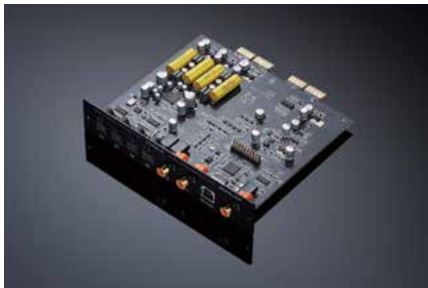
型番：DM35 / 価格：¥75,000 (税別)

DM35は、I25やI35やPRE35にUSB-DAC機能を追加するためのオプション・モジュールです。心臓部にはAKMの32bitステレオDACであるAK4497EQを採用。-128dBのS/N比、-116dBのTHD+Nを実現し、新開発のOSD Doublerフィルターによって200kHzまでフラットなノイズフロアを達成。アンプに最新DACをビルトインできるメリットは、PRIMAREの多層基板構造の素晴らしさも相まって恐ろしくピュアなサウンドを実現できる事にこそあります。SM35をさらに追加すれば、PRISMA機能にも対応させる事が可能です。