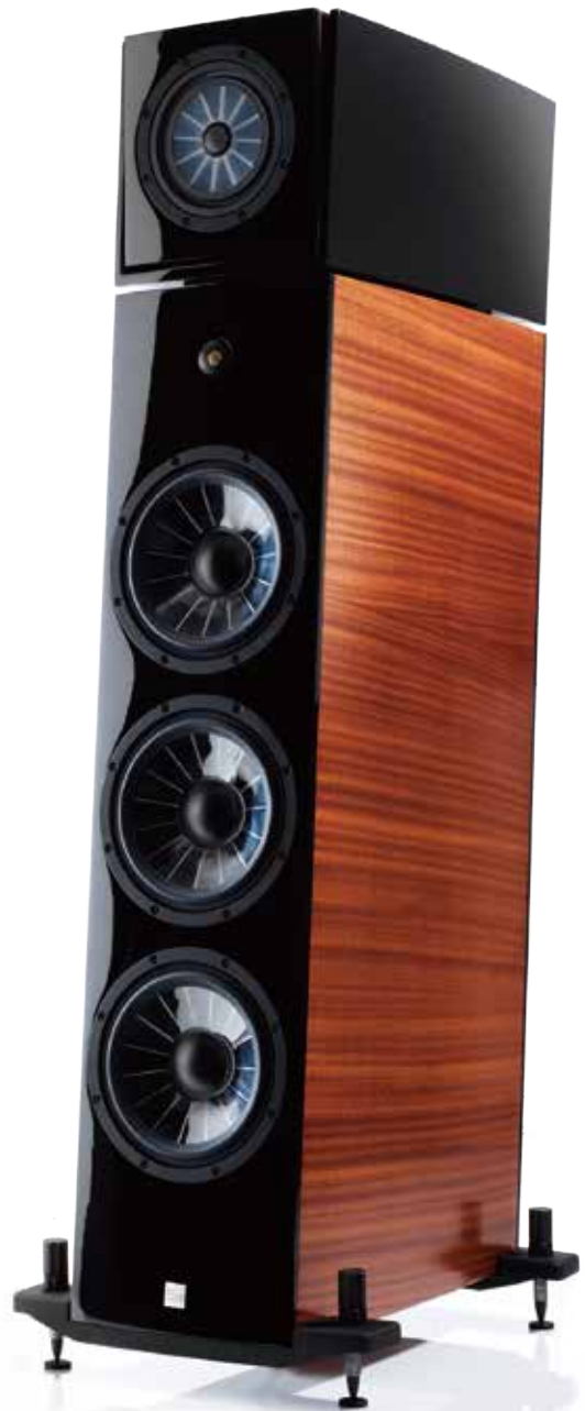
Model : THE MUSIC SAPELE (カラー : Sapele) JAN : 4571408310269