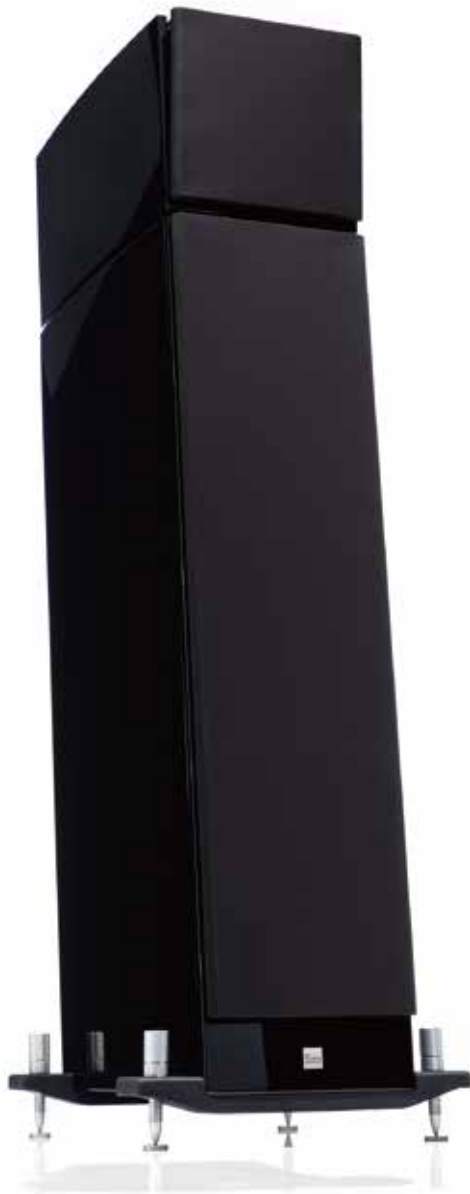
Model : THE MUSIC BLACK (カラー : PianoBlack) JAN : 4571408310276