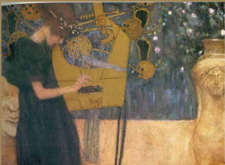
Gustav Klimt: The Music, 1895